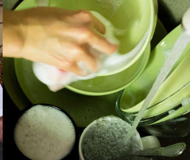
Plastic wegwerpborden en -kommen zijn vervangen door herbruikbare porseleinen houders.

Deze veranderingen hebben ook de ervaring van patiënten verbeterd. Patiënten geven de voorkeur aan herbruikbare artikelen omdat deze meer lijken op wat ze zijn gewend thuis te gebruiken.